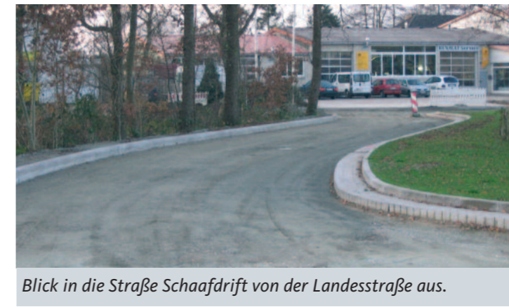
Blick in die Straße Schaafdrift von der Landesstraße aus.

oder umgeleitet werden, welches eine weitere Verzögerung der Fertigstellung zur Folge hatte. Ende November wurde die Decktragschicht eingebaut. Zur Fertigstellung der Fahrbahnen mit einer weiteren Bitumen-decke benötigt man 6 bis 8 Grad Celsius. Die Fertigstellung konnte nicht ausgeführt werden, weil der Winter mit Minustemperaturen hereinbrach. So wird der Ausbau wohl erst im Frühjahr beendet sein. Ein weiterer Diskussionspunkt war die Trassenführung der Straße Schaafdrift. Für den landwirtschaftlichen Verkehr zu schmal und zu kurvenreich, insbesondere, wenn man von der Landstraße einbiegt. Bürgermeister Krüger berichtete auf der letzten Ortsratssitzung, dass den Anliegern keine Mehrkosten entstehen würden.