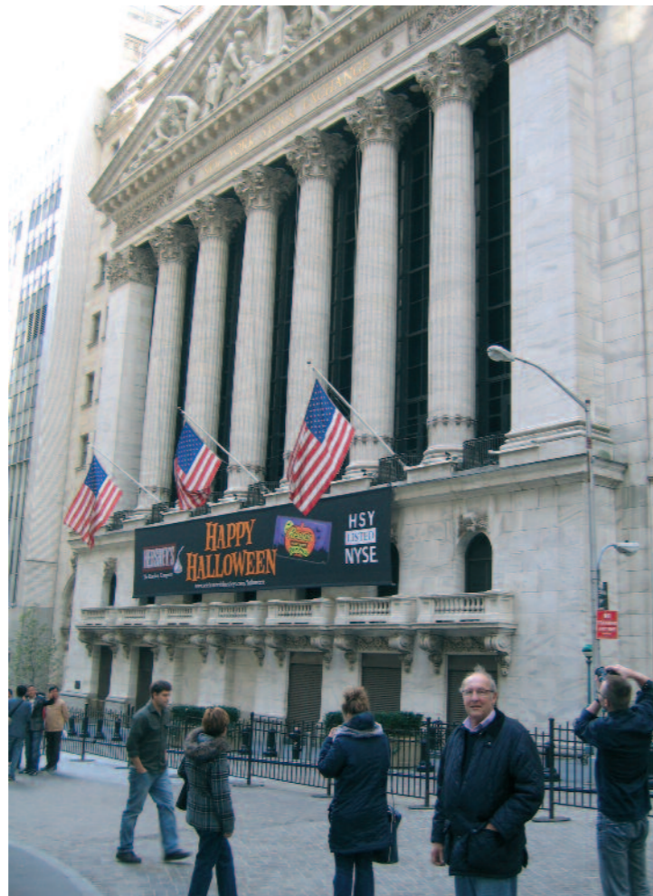
Vor der New Yorker Börse