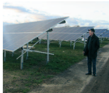
Ortsbürgermeister Herbert Peters

haben Ortsrat und Stadtverwaltung dieses Thema offensiv angegangen. Diese Form von Energiegewinnung wurde bevorzugt. Der vorhandene Windpark Krempel und der neue Solarpark liefern einen großen Anteil an regenerativer Energie, der die Energieversorgung z.B. von Krempel bei weitem übersteigt.