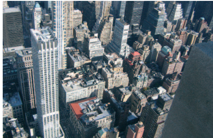
Der Blick vom Empire State Building

Touristen. Ein Geheimtip für neues Wohnen in Harlem-Apartments von 2-10 Mio Dollar. Der „Jet-Lag“ konnte sich gar nicht richtig auswirken, schon war man wieder in der Heimat.