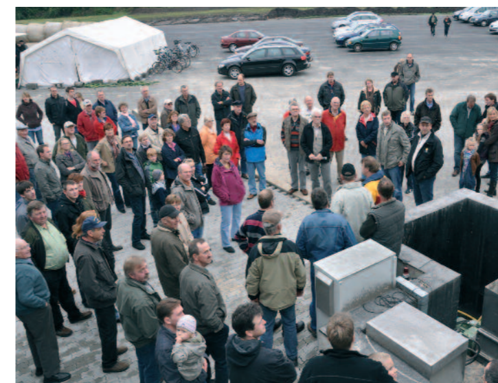
Schon sehr viele Besucher kamen zur ersten Führung, eine weitere gab es für den nächsten Schwung Interessierte

offenen Tür“ genutzt, um sich die Biogasanlage anzuschauen und um sich zu informieren. Das Volk mag gemischt gewesen sein: Befürworter – Gegner – Interessierte. Die gegebenen Informationen mochten vielleicht reichen, sich eine Meinung zu bilden. Aber sicher ist: Energie ist lebensnotwendig - und erneuerbare Energie sind ein Schritt in die richtige Richtung.